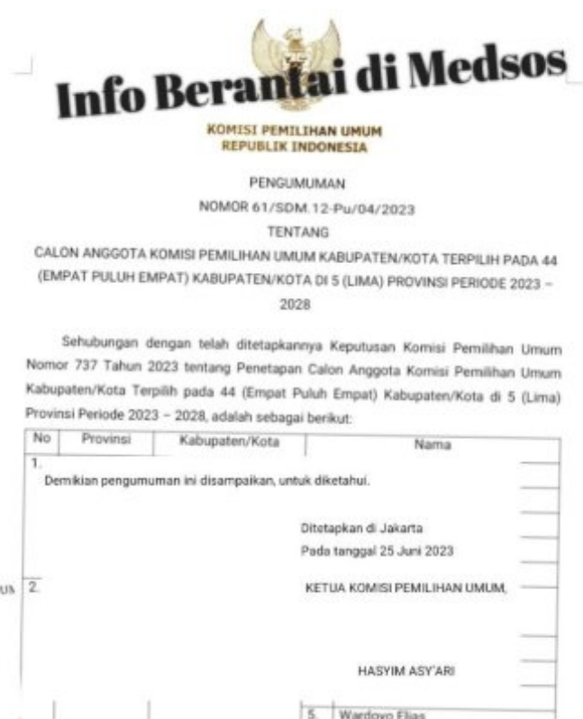
Gambar Pengumuman KPU RI Secara Resmi dan Yang Tersebar Luas di Media WhatsApp

BAUBAU - Beredar Pengumuman Calon Komisiner KPU pada 44 Kabupaten/Kota di 5 Propinsi yakni Sulawesi Utara, Sulawesi Selatan, Sulawesi Barat, Sulawesi Tenggara, dan Kepulauan Riau di Sinyalir menjadi berita bohong atau HOAX.